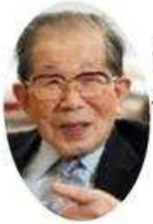
日野原 重明 先生 (聖路加国際病院 理事長)