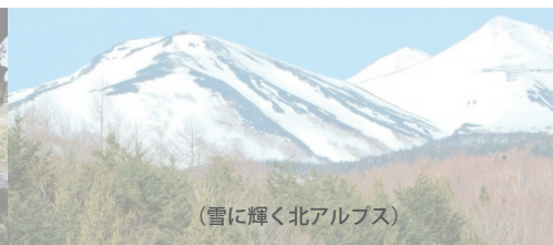
(雪に輝く北アルプス)